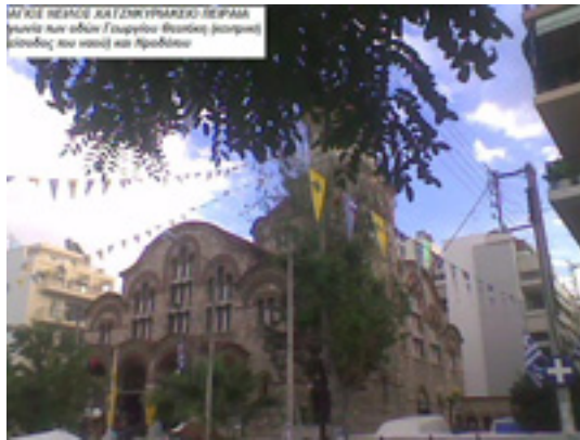
Η μοναδική εκκλησία στην Ελλάδα που είναι αφιερωμένη στον Οσιο Νείλο το Μυροβλήτη. Χατζηκυριάκειο, Πειραιάς.