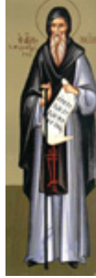
Όσιος Νείλος ο Μυροβλύτης