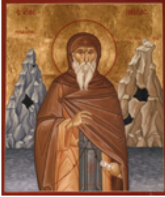
Όσιος Νείλος ο Μυροβλύτης