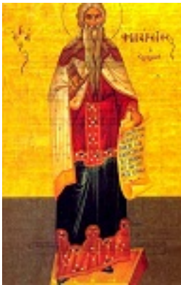
Άγιος Φιλάρετος ο Ελεήμων