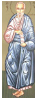
Άγιος Φιλάρετος ο Ελεήμων