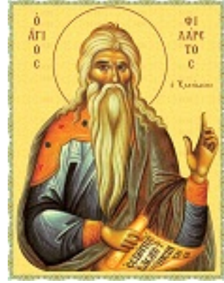
Άγιος Φιλάρετος ο Ελεήμων