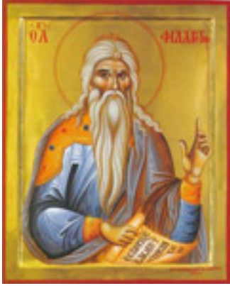
Άγιος Φιλάρετος ο Ελεήμων