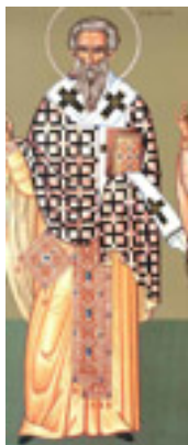
Άγιος Κλήμης Ιερομάρτυρας επίσκοπος Ρώμης