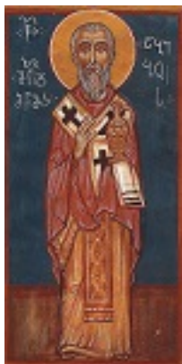
Άγιος Άβιβος επίσκοπος Γεωργίας, Ιερομάρτυρας