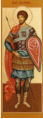
Άγιος Βίκτωρ<br />ο Μεγαλομάρτυρας