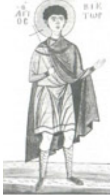
Άγιος Βίκτωρ<br />ο Μεγαλομάρτυρας