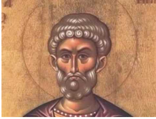
Ακούστε το απολυτίκιο!