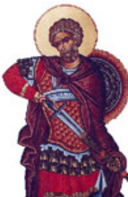
Άγιος Μηνάς «ό έν τῷ Κοτυαείω» ο Μεγαλομάρτυρας