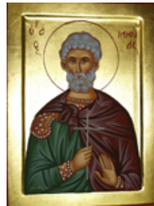
Άγιος Μηνάς «ό έν τῷ Κοτυαείω» ο Μεγαλομάρτυρας - Λυδία Γουριώτη© (lydiagourioti- iconography.blogspot.com)