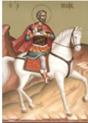
Άγιος Μηνάς «ό έν τῷ Κοτυαείω» ο Μεγαλομάρτυρας