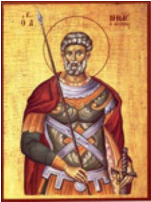
Άγιος Μηνάς «ό έν τῷ Κοτυαείω» ο Μεγαλομάρτυρας