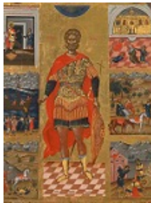
Άγιος Μηνάς «ό έν τῷ Κοτυαείω» ο Μεγαλομάρτυρας - Εμμανουήλ Λαμπάρδος, αρχές 17ου αιώνα μ.Χ.