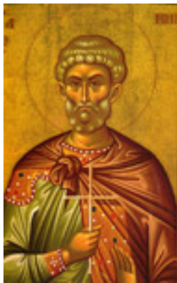
Άγιος Μηνάς «ό έν τῷ Κοτυαείω» ο Μεγαλομάρτυρας