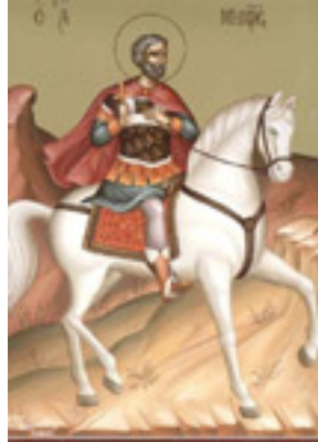
Άγιος Μηνάς «ό έν τῷ Κοτυαείω» ο Μεγαλομάρτυρας