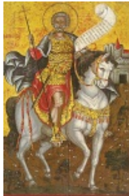
Άγιος Μηνάς «ό έν τῷ Κοτυαείω» ο Μεγαλομάρτυρας