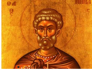
Ακούστε το απολυτίκιο!