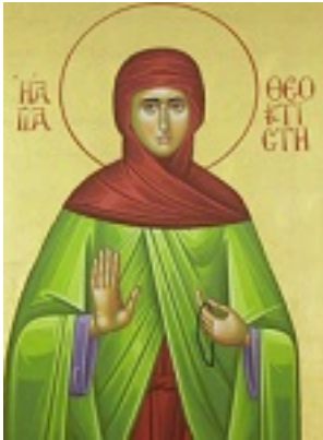
Οσία Θεοκτίστη η Λέσβια