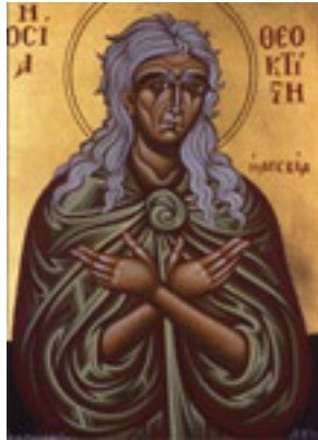
Οσία Θεοκτίστη η Λέσβια