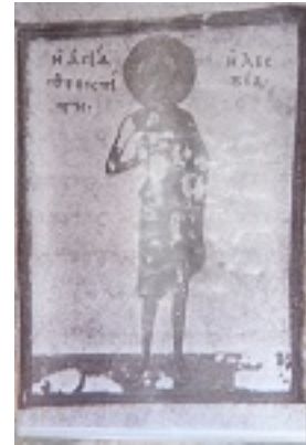
Οσία Θεοκτίστη η Λέσβια - Παροικιά Πάρου