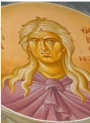
Οσία Θεοκτίστη η Λέσβια