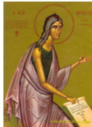
Οσία Θεοκτίστη η Λέσβια