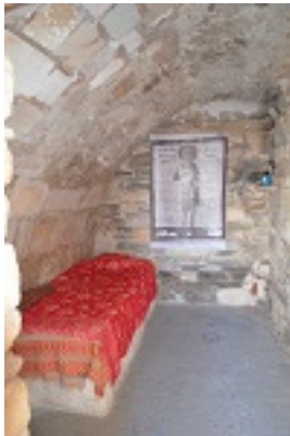
Το κελί της Οσίας Θεοκτίστης στην Παροικιά Πάρου