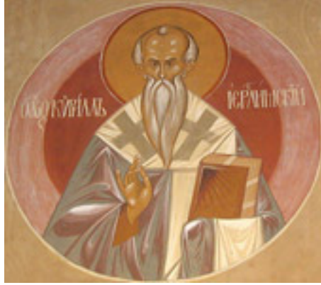
Άγιος Κύριλλος<br />Αρχιεπίσκοπος Ιεροσολύμων