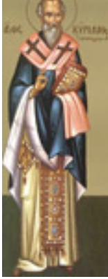
Άγιος Κύριλλος<br />Αρχιεπίσκοπος Ιεροσολύμων