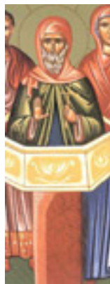
Όσιος Λάζαρος ο Θαυματουργός, ο Γαλιλαιώτης