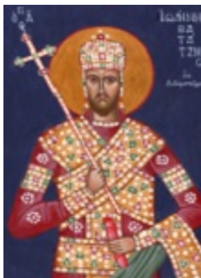
Άγιος Ιωάννης ο Βατατζής ο ελεήμονας βασιλιάς