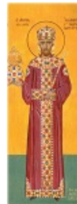
Άγιος Ιωάννης ο Βατατζής ο ελεήμονας βασιλιάς