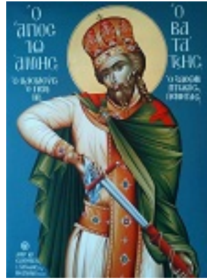
Άγιος Ιωάννης ο Βατατζής ο ελεήμονας βασιλιάς