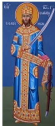
Άγιος Ιωάννης ο Βατατζής ο ελεήμονας βασιλιάς - Σάββας Παντζαρίδης©