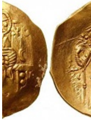
Ο Άγιος Ιωάννης Βατάτζης στέφεται από την Παναγία σε υπέρπυρον (χρυσό νόμισμα)