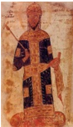
Άγιος Ιωάννης ο Βατατζής ο ελεήμονας βασιλιάς