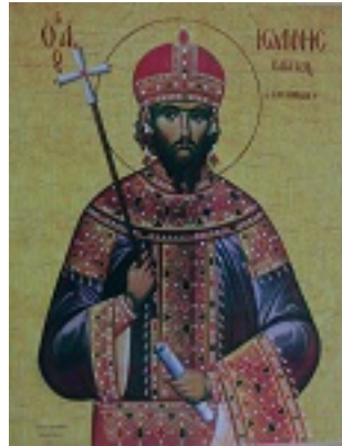
Άγιος Ιωάννης ο Βατατζής ο ελεήμονας βασιλιάς