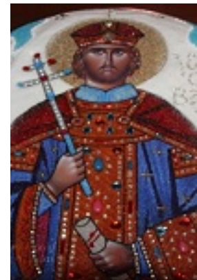
Άγιος Ιωάννης ο Βατατζής ο ελεήμονας βασιλιάς