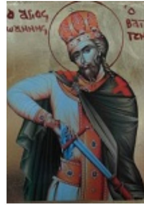
Άγιος Ιωάννης ο Βατατζής ο ελεήμονας βασιλιάς