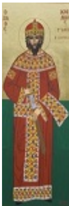
Άγιος Ιωάννης ο Βατατζής ο ελεήμονας βασιλιάς