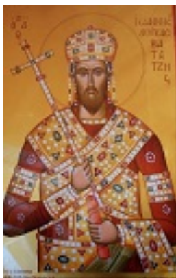
Άγιος Ιωάννης ο Βατατζής ο ελεήμονας βασιλιάς