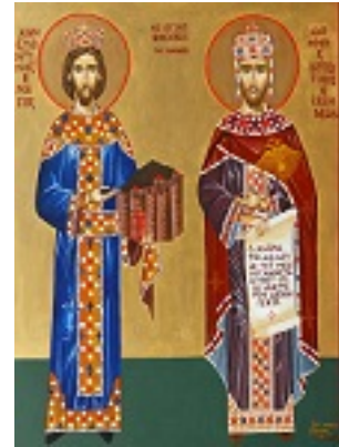
Ο Άγιος Ιωάννης Βατάτζης και ο Άγιος Κωνσταντίνος - Δια χειρός Δέσποινας Σαρσάκη