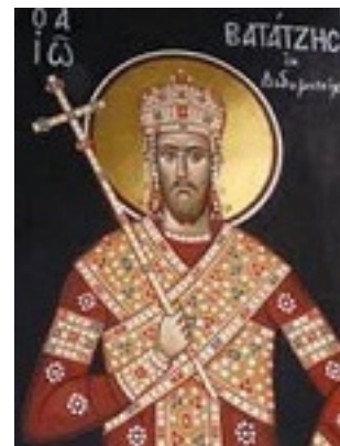
Άγιος Ιωάννης ο Βατατζής ο ελεήμονας βασιλιάς