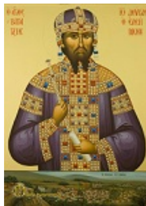
Άγιος Ιωάννης ο Βατατζής ο ελεήμονας βασιλιάς