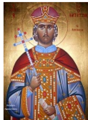
Άγιος Ιωάννης ο Βατατζής ο ελεήμονας βασιλιάς