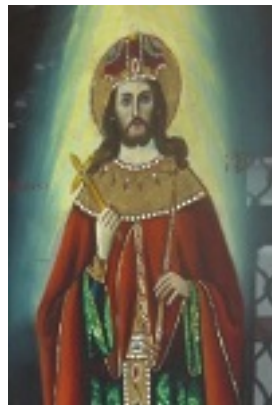
Άγιος Ιωάννης ο Βατατζής ο ελεήμονας βασιλιάς