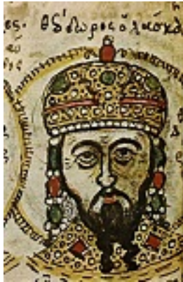
Άγιος Ιωάννης ο Βατατζής ο ελεήμονας βασιλιάς