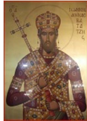
Άγιος Ιωάννης ο Βατατζής ο ελεήμονας βασιλιάς