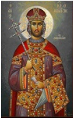
Άγιος Ιωάννης ο Βατατζής ο ελεήμονας βασιλιάς