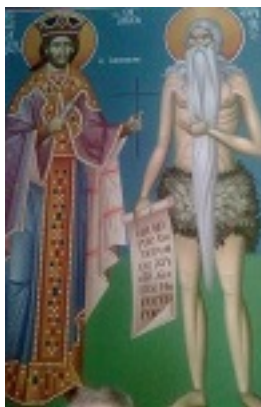
Ο Άγιος Ιωάννης Βατάτζης και ο Όσιος Ονούφριος