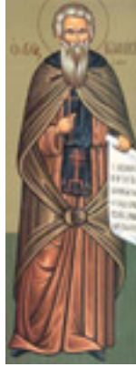
Ἵσιος Ἰωαννίκιος ο Μεγάλος «ὁ ἐν Ὀλύμπῳ»