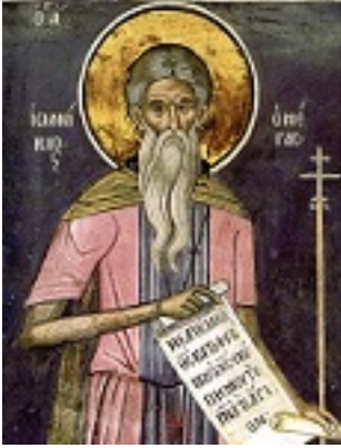
Ἵσιος Ἰωαννίκιος ο Μεγάλος «ὁ ἐν Ὀλύμπῳ»