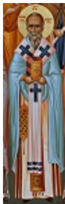
Όσιος Αθανάσιος Α' Πατριάρχης Κωνσταντινούπολης