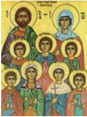
Άγιοι Τερέντιος και Νεονίλλη οι σύζυγοι και τα παιδιά τους Σάρβηλος, Νίτας, Ιέραξ, Θεόδουλος, Φώτιος, Βήλη και Ευνίκη