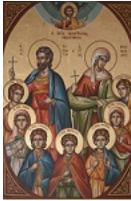
Άγιοι Τερέντιος και Νεονίλλη οι σύζυγοι και τα παιδιά τους Σάρβηλος, Νίτας, Ιέραξ, Θεόδουλος, Φώτιος, Βήλη και Ευνίκη