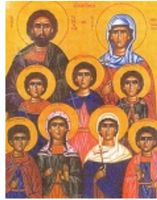
Άγιοι Τερέντιος και Νεονίλλη οι σύζυγοι και τα παιδιά τους Σάρβηλος, Νίτας, Ιέραξ, Θεόδουλος, Φώτιος, Βήλη και Ευνίκη