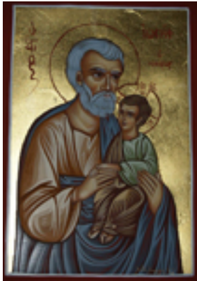
Άγιος Ιωσήφ ο μνήστωρ - Λυδία Γουριώτη© ( http://lydiagourioti-iconography.blogspot.com )