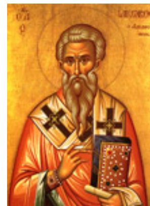
Άγιος Ιάκωβος ο Απόστολος και Αδελφόθεος