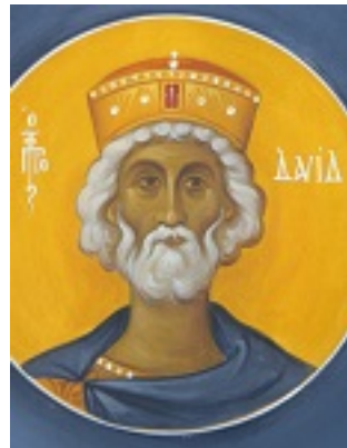
Προφήτης Δαβίδ - Ι. Ν. Οσίων Παρθενίου και Ευμενίου των εν Κουδουμά, δια χειρός Παναγιώτη Μόσχου (2006 μ.Χ.)