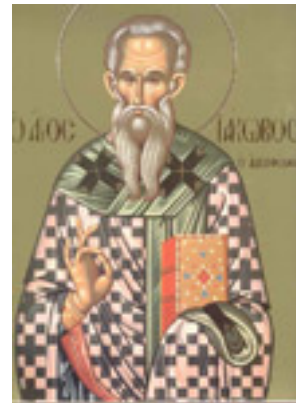
Άγιος Ιάκωβος ο Απόστολος και Αδελφόθεος