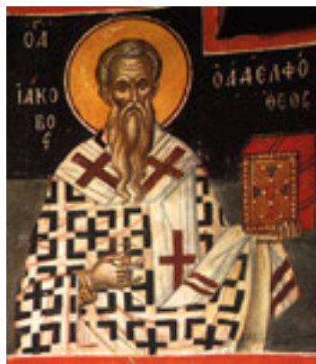
Άγιος Ιάκωβος ο Απόστολος και Αδελφόθεος