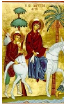
Φυγή Ιησού Χριστού στην Αίγυπτο