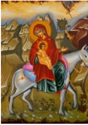
Φυγή Ιησού Χριστού στην Αίγυπτο - Λυδία Γουριώτη© ( http://lydiagourioti- iconography.blogspot.com )