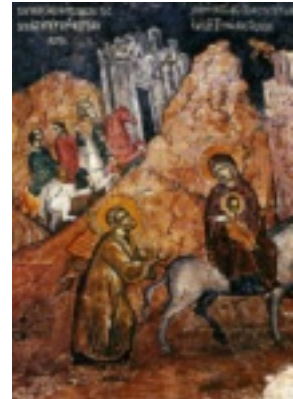
Φυγή Ιησού Χριστού στην Αίγυπτο - Μονή Αγίου Νεοφύτου