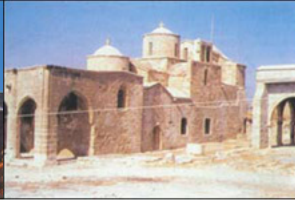
Βυζαντινή εκκλησία στο χώρο αρχαίας Λαπήθου - Λάμπουσας