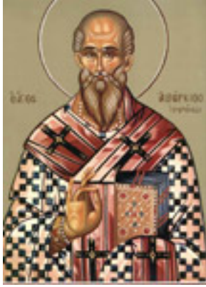
Όσιος Αβέρκιος ο Ισαπόστολος και θαυματουργός επίσκοπος Ιεράπολης