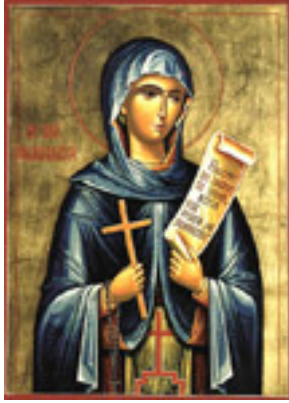
Οσία Παρασκευή η Νέα η «Επιβατηνή»