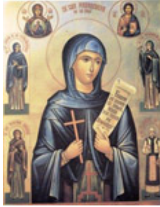
Οσία Παρασκευή η Νέα η «Επιβατηνή»