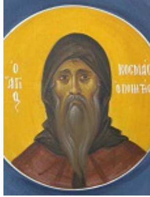
Άγιος Κοσμάς ο Μελωδός επίσκοπος Μαΐουμά - Ι. Ν. Οσίων Παρθενίου και Ευμενίου των εν Κουδουμά, δια χειρός Παναγιώτη Μόσχου (2006 μ.Χ.)