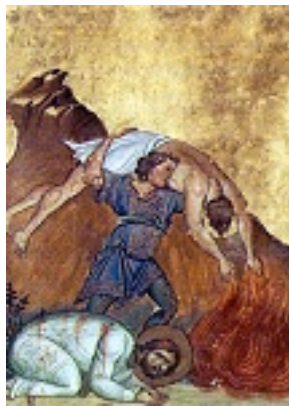
Άγιοι Κάρπος, Πάπυλος, Αγαθόδωρος και Αγαθονίκη