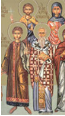
Άγιοι Κάρπος, Πάπυλος, Αγαθόδωρος και Αγαθονίκη