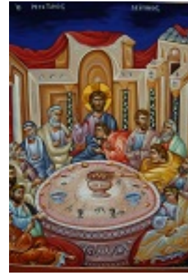
Μυστικός Δείπνος - Αντίγραφο τοιχογραφίας τής Μονής Βατοπεδίου - Αγγελική Τσέλιου© ( diacheirosaggelikistseliou.blogspot.com )