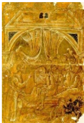
Ο Νυπτήρας - 16ος αι. μ.Χ. - Μονή Διονυσίου, Άγιον Όρος