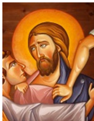
Τό φιλί τού Ιούδα - Αγγελική Τσέλιου© ( diacheirosaggelikistseliou.blogspot.com )