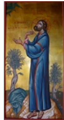
Η προσευχή εν τη Γεσθήμανη - Αγγελική Τσέλιου© ( diacheirosaggelikistseliou.blogspot.com )