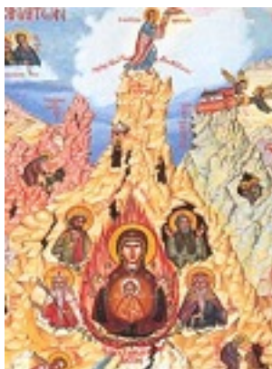
Σύναξη πάντων των Σιναϊτών Αγίων