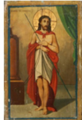
Ιδού, ο Νυμφίος έρχεται.... - Ι.Ν. Ζωοδόχου Πηγής, Λαρίσης (www.panagialarisis.gr)