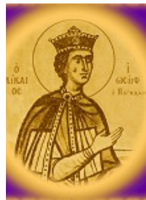
Ο πάγκαλος Ιωσήφ