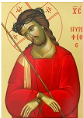
Ιδού, ο Νυμφίος έρχεται....