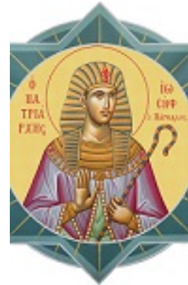
Ο πάγκαλος Ιωσήφ