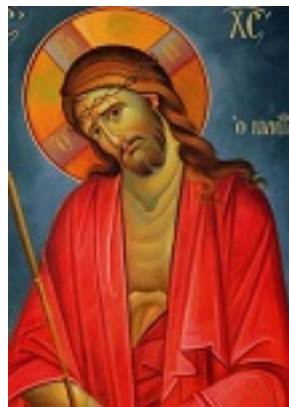
Ιδού, ο Νυμφίος έρχεται....