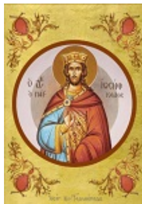
Ο πάγκαλος Ιωσήφ