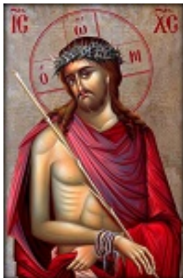
Ιδού, ο Νυμφίος έρχεται....