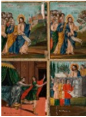
Αρχή της Μεγάλης Εβδομάδας