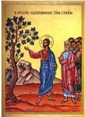
Η ξηρανθείσα συκή