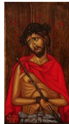
Ιδού, ο Νυμφίος έρχεται....