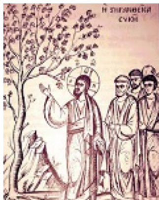
Η ξηρανθείσα σική