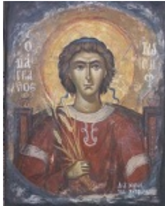
Ο πάγκαλος Ιωσήφ