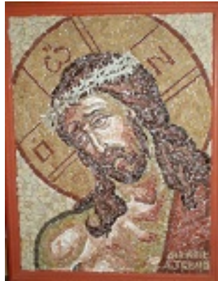
Ιδού, ο Νυμφίος έρχεται.... - Αγγελική Τσέλιου© (diaxeirosaggelikistseliou. blogspot.com)