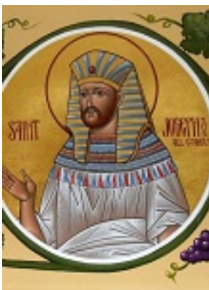
Ο πάγκαλος Ιωσήφ