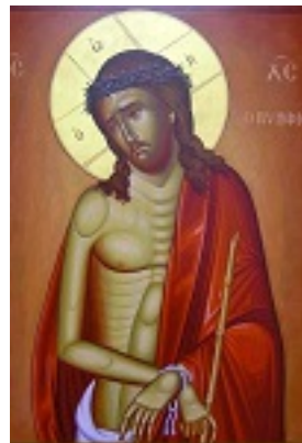
Ιδού, ο Νυμφίος έρχεται....