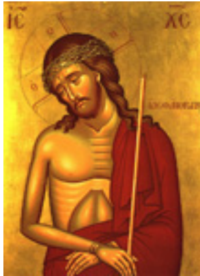
Ίδε ο άνθρωπος