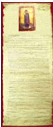
Η περγαμνή της Capella Palatina του Παλέρμου