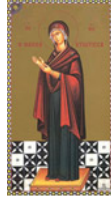
Σύναξη της Υπεραγίας Θεοτόκου της «Ναυπακτιώτισσας»