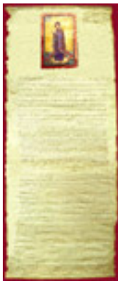
Η περγαμνή της Capella Palatina του Παλέρμου