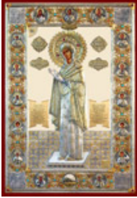
Σύναξη της Υπεραγίας Θεοτόκου της «Ναυπακτιώτισσας»