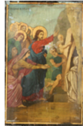
Ανάσταση του Λαζάρου - Ι.Ν. Ζωοδόχου Πηγής, Λαρίσης ( www.panagialarisis.gr )