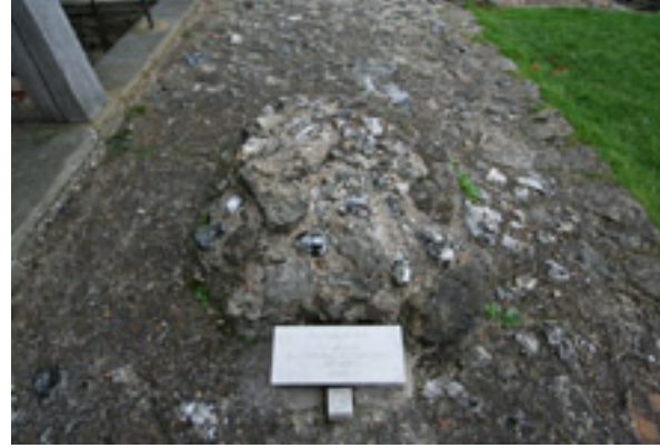
Ο τάφος του Αγίου Αυγουστίνου