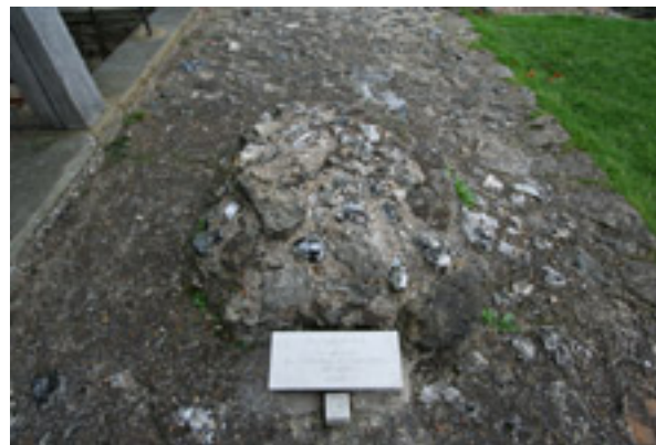
Ο τάφος του Αγίου Αυγουστίνου