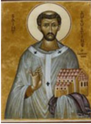
Άγιος Αυγουστίνος Αρχιεπίσκοπος Καντουαρίας