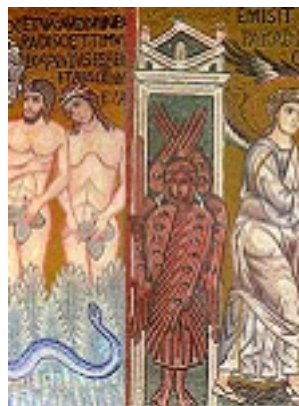
Η εξορία των Πρωτοπλάστων