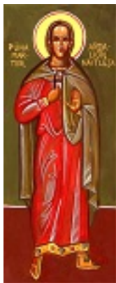
Άγιος Αρδαλίων ο Μίμος