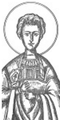
Άγιος Αρδαλίων ο Μίμος