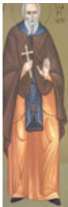
Όσιος Ιλαρίων ο Νέος