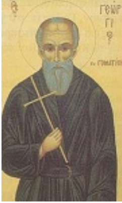
Όσιος Γεώργιος ο εκ Γοματίου