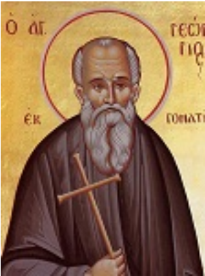
Όσιος Γεώργιος ο εκ Γοματίου