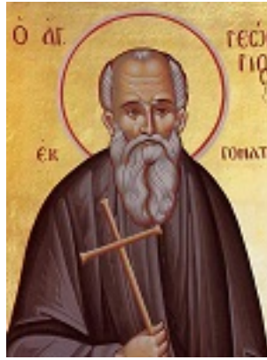
Όσιος Γεώργιος ο εκ Γοματίου