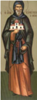
Άγιος Ευθύμιος ο Νέος