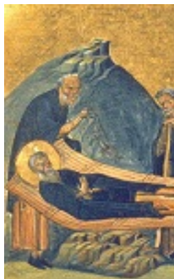
Όσιος Αμμούν ο Αιγύπτιος