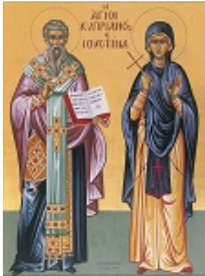
Άγιος Κυπριανός και Αγία Ιουστίνη