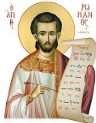
Όσιος Ρωμανός ο Μελωδός