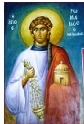
Όσιος Ρωμανός ο Μελωδός