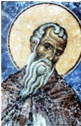
Ὅσιος Ιλαρίων ο Μέγας