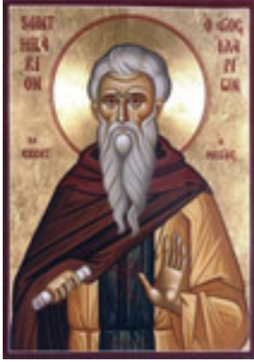
Ὅσιος Ιλαρίων ο Μέγας