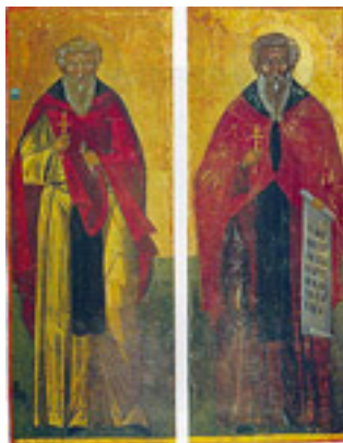
Όσιοι Βαρνάβας και Ιλαρίων οι θαυματουργοί