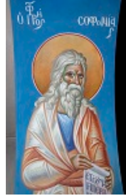
Προφήτης Σοφονίας - π. Σταμάτης Σκλήρης© (stamatis-skliris.gr)