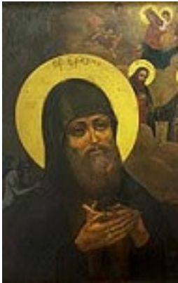
Όσιος Έρασμος εκ Ρωσίας