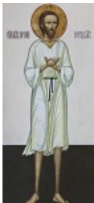
Όσιος Προκόπιος της Βιάτκα ο δια Χριστόν σαλός