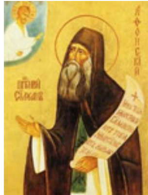
Άγιος Σιλουανός ο Αγιορείτης