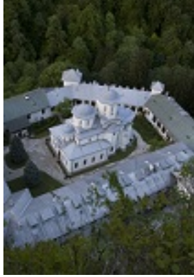
Ιερά Μονή Τισμάνα