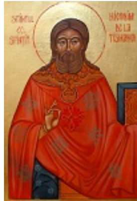
Όσιος Νικόδημος της Τισμάνα