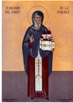
Όσιος Νικόδημος της Τισμάνα