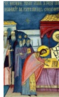
Η Χειροτονία του Οσίου Νικοδήμου της Τισμάνα