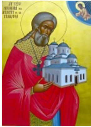
Όσιος Νικόδημος της Τισμάνα