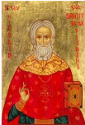
Όσιος Νικόδημος της Τισμάνα