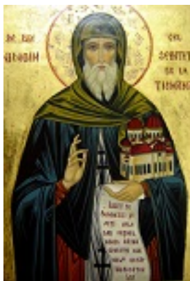
Όσιος Νικόδημος της Τισμάνα