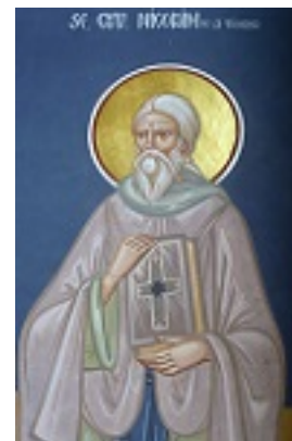
Όσιος Νικόδημος της Τισμάνα