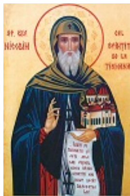
Όσιος Νικόδημος της Τισμάνα