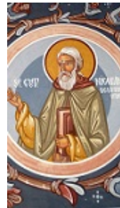
Όσιος Νικόδημος της Τισμάνα