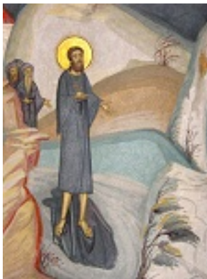
Ο Όσιος Νικόδημος της Τισμάνα διασχίζει το Δούναβη