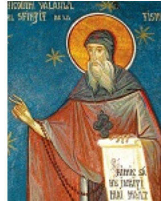
Όσιος Νικόδημος της Τισμάνα