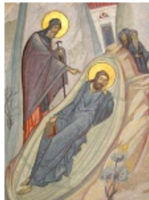
Η εμφάνιση του Αγίου Αντωνίου του Μεγάλου σε όνειρο του Οσίου Νικοδήμου της Τισμάνα