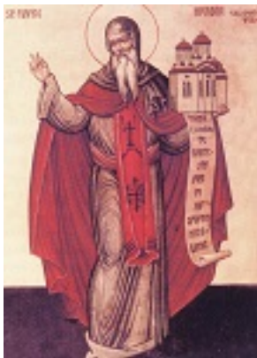
Όσιος Νικόδημος της Τισμάνα