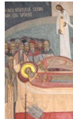
Η κοίμηση του Οσίου Νικοδήμου της Τισμάνα