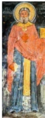
Όσιος Νικόδημος της Τισμάνα