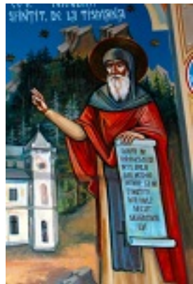
Όσιος Νικόδημος της Τισμάνα