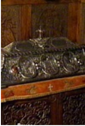
Λειψανοθήκη με τα Λείψανα του Οσίου Νικοδήμου της Τισμάνα