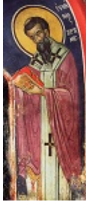
Όσιος Ευμένιος ο θαυματουργός, επίσκοπος Γορτύνης