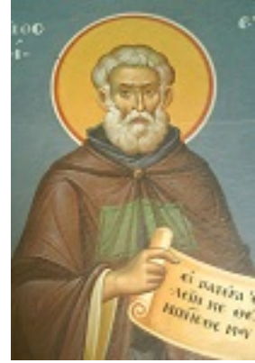
Όσιος Ευμένιος ο θαυματουργός, επίσκοπος Γορτύνης