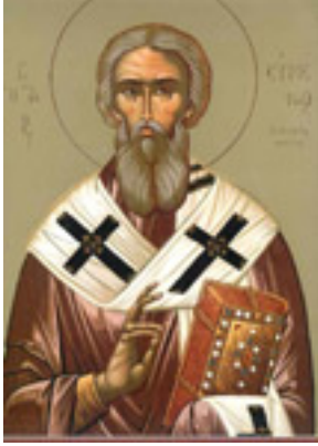
Όσιος Ευμένιος ο θαυματουργός, επίσκοπος Γορτύνης