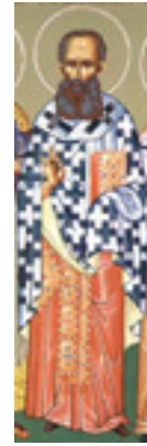
Άγιος Βησσαρίων Αρχιεπίσκοπος Λαρίσης