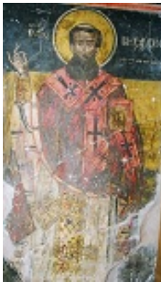
Άγιος Βησσαρίων Αρχιεπίσκοπος Λαρίσης