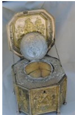
Η αγία κάρα του Αγίου Βησσαρίωνα Αρχιεπισκόπου Λαρίσης