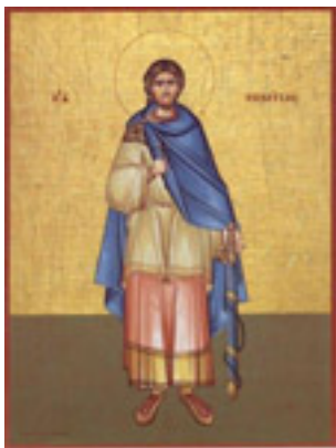
Άγιος Νικήτας ο Γότθος ο μεγαλομάρτυρας