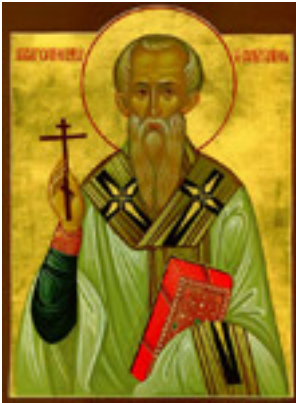
Άγιος Κορνήλιος ο Εκατόνταρχος