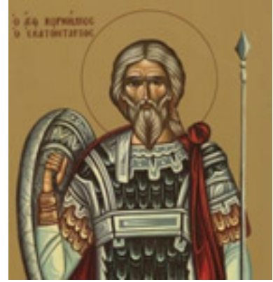
Άγιος Κορνήλιος ο Εκατόνταρχος