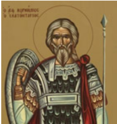
Άγιος Κορνήλιος ο Εκατόνταρχος