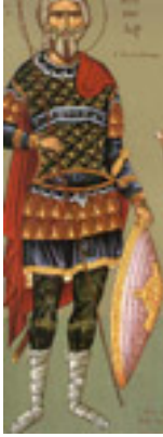
Άγιος Κορνήλιος ο Εκατόνταρχος