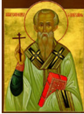
Άγιος Κορνήλιος ο Εκατόνταρχος