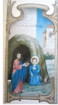
Όσιος Ιωάννης ο Καλυβίτης