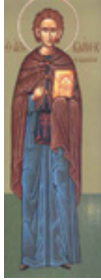
Όσιος Ιωάννης ο Καλυβίτης