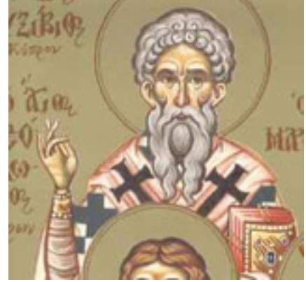
Άγιος Αυξίβιος Επίσκοπος Σόλων Κύπρου