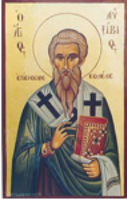
Άγιος Αυξίβιος Επίσκοπος Σόλων Κύπρου