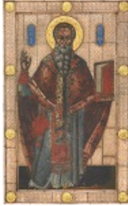
Άγιος Αυξίβιος Επίσκοπος Σόλων Κύπρου