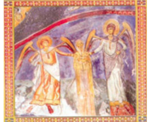
Ἵσιος Νεόφυτος ὁ ἐγκλειστος που ασκήτευσε στην Κύπρο