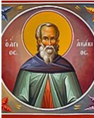
Όσιος Ακάκιος ο Νέος, ο Καυσοκαλυβίτης