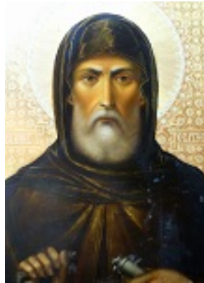
Όσιος Ακάκιος ο Νέος, ο Καυσοκαλυβίτης