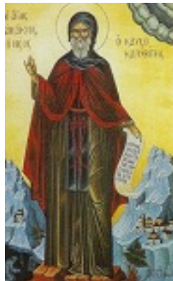
Όσιος Ακάκιος ο Νέος, ο Καυσοκαλυβίτης