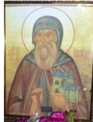
Όσιος Ακάκιος ο Νέος, ο Καυσοκαλυβίτης - Ι. Ν. Κοιμήσεως Θεοτόκου Χαϊδαρίου