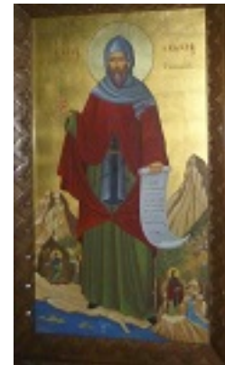
Προσκυνητάρι του Αγίου Ακακίου στην Ι. Μονή Αγ. Νεκταρίου Γαργηττού Αγ. Παρασκευής