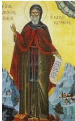
Όσιος Ακάκιος ο Νέος, ο Καυσοκαλυβίτης