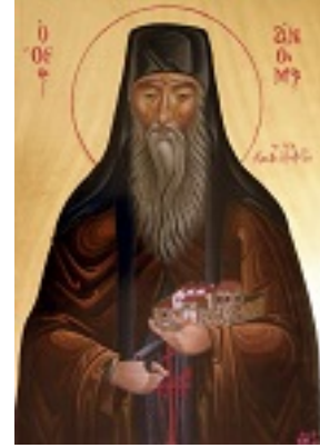
Όσιος Άνθιμος ο νέος ασκητής από την Κεφαλονιά