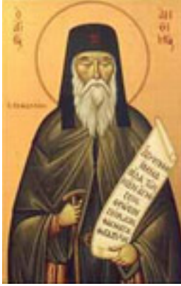
Όσιος Άνθιμος ο νέος ασκητής από την Κεφαλονιά