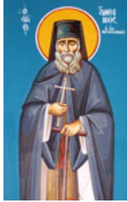
Όσιος Άνθιμος ο νέος ασκητής από την Κεφαλονιά